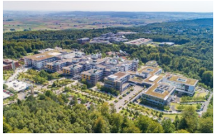
(UKGM) Universitätsklinikum Gießen und Marburg